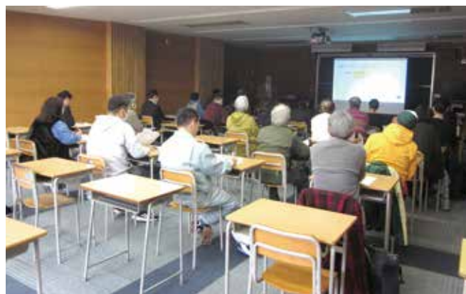
支援者向け訓練（講師の講義を通して「やさしい日本語」など、支援者の少しの工夫が外国人市民を助けることを学びました。）