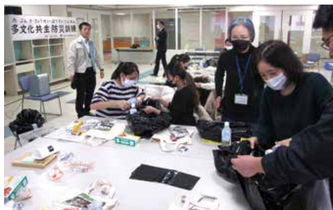
外国人向け訓練（実際に水を使って携帯トイレを体験するなど防災用品の使い方を学びました。）