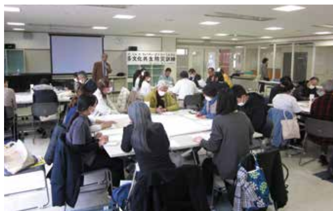
地域、企業、学校、行政などさまざまな立場の人が混在したグループに分かれて実施したワークショップの様子。

開催にあたり、災害時の避難所を運営する委員会のメンバーである地元の自治会（大和南自治連合会、大和東一丁目自治会、光丘自治会）や光丘中学校教職員のほか、相鉄企業株式会社、社会福祉法人プレマ会のみなさんにご協力をいただきました。災害ボランティアセンターの運営主体となる大和市役所市民活動課と社会福祉協議会にもご参加いただきました。今後も大きな災害発生時に備えるため、関係団体との連携を進めるとともに、外国人市民が災害のときも信頼のおける情報にアクセスしやすくなる環境づくりに取り組んでまいります。