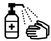
Desinfectelas con alcohol.

Para obtener más información sobre la eficacia y seguridad de la vacuna contra el COVID-19, consulte la página "Acerca de la vacuna contra el COVID-19" (Shingata korona wakuchin ni tsuite) en la página web del Ministerio de Salud, Trabajo y Bienestar.