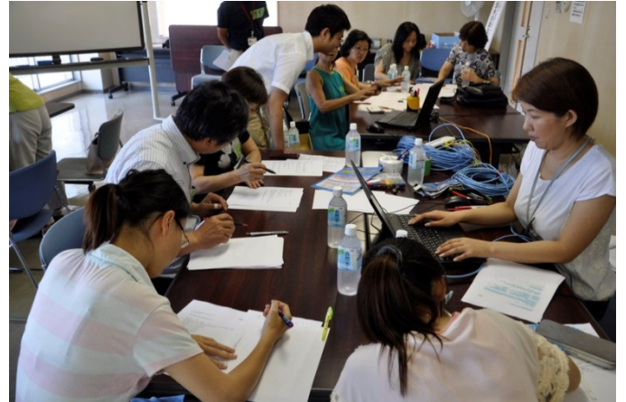
8 ホームページに ほんやく 翻訳した じょうほう 情報を ちゅうごくご アップ (中国語)