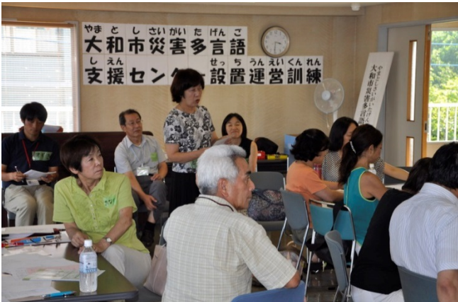
13 各グループ かく からの ほうこく 報告①