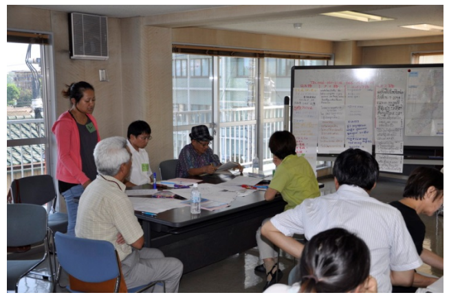
12 多言語支援センター たげんごしえん 掲示板 けいばん (タイ・ラオス・カンボジア語)