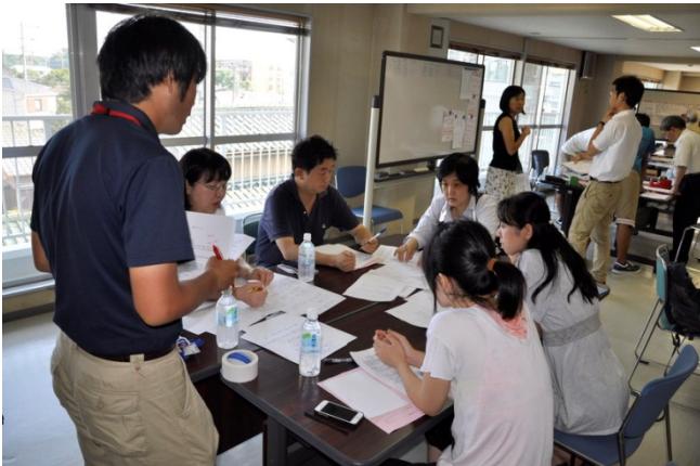
11 FM やまと じょうほうていきょう (ラジオ) への情報提供 (英語)